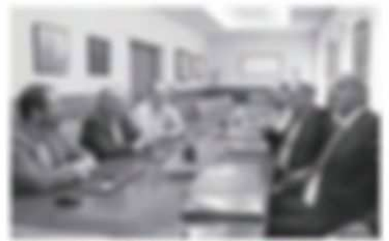
Los representantes del Puerto en la reunión con la delegación cubana

La ampliación del Canal de Pasarela -inaugurada oficialmente el pasado 26 de junio- ha provocado una reorganización de rutas de transporte marítimo, y el Puerto Exterior de Ferrol espera acoger nuevos tráfico que pasan por la bahía de Ferrol gracias a sus características, que facilitarán el atarjeo de buques cada vez más grandes y con un mayor volumen de carga. ■